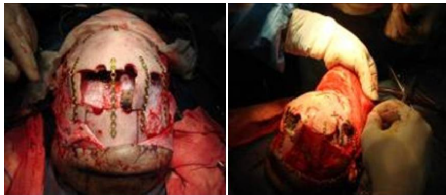
شکل (۳): ایجاد پل استخوانی و اتصال پلیت بر روی آن.

برای ایجاد یک فضای مناسب جهت قرارگیری جمجمه و کاهش فشار وارد بر چشم‌ها، دو پل استخوانی از جمجمه بریده می‌شود و بین دو قسمت قدامی و خلفی جمجمه قرار می‌گیرد. در پایان، اتصال قطعات جمجمه از طریق