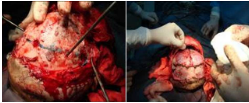
شکل (۲): ایجاد حفره بر روی جمجمه و برش عرضی آن.

پلیت با جنس استیل صورت می‌پذیرد. در شکل (۳)، نحوه قرارگرفتن پل‌های استخوانی و پلیت‌ها بر روی جمجمه نشان داده شده‌است.