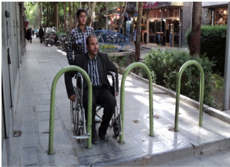
تصویر ۷: وجود موانع در ابتدای برخی ورودی‌ها