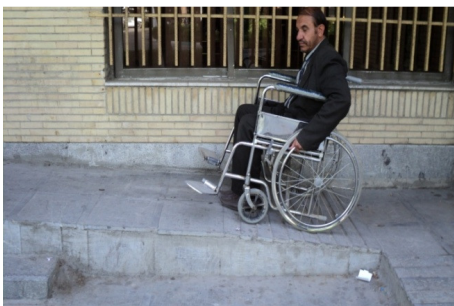
تصویر ۸: نصب‌نشدن دستگیره در طرفین رامپ