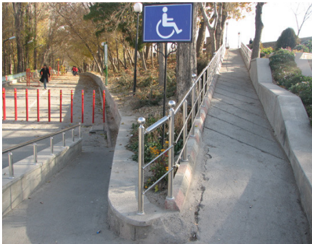
تصویر ۱۲: مناسب‌سازی پارک ائل گلی تبریز برای جانبازان و معلولین (منبع: ۲۱)