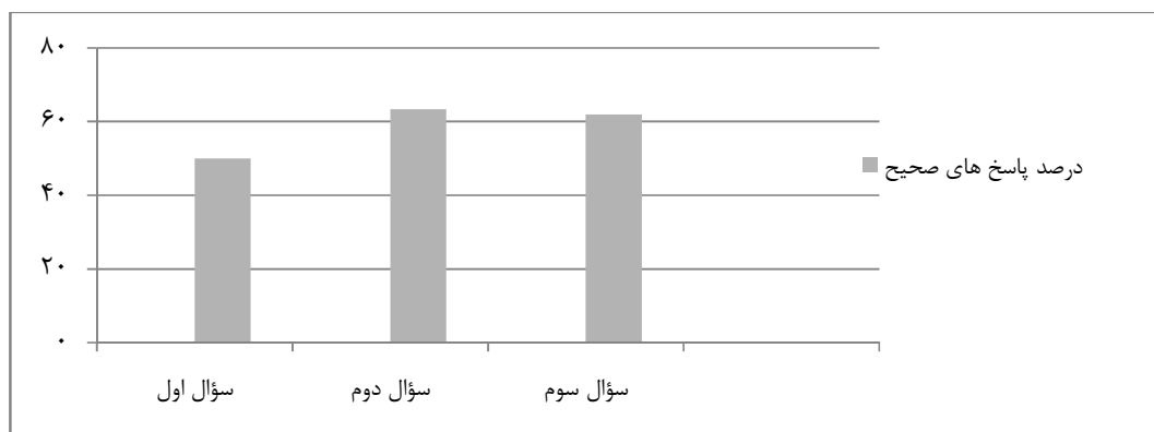
نمودار ۲: میانگین درصد پاسخ های صحیح به پرسش‌نامه آگاهی از علوم توانبخشی

از آنجا که حداقل و حداکثر امتیازی که می‌توان در مورد هر یک از علوم توانبخشی کسب نمود با یکدیگر متفاوت است؛ لذا جهت یکدست نمودن داده ها و برای اینکه بتوانیم میانگین امتیازات کسب شده در علوم مختلف توانبخشی را با یکدیگر مقایسه نماییم؛ بهتر است حداکثر امتیازات را از ۱۰۰٪ در نظر بگیریم. به این منظور، نمره خالص آزمودنی را بر نمره خالص کل تقسیم کرده و مقدار به دست آمده را بر حسب درصد محاسبه