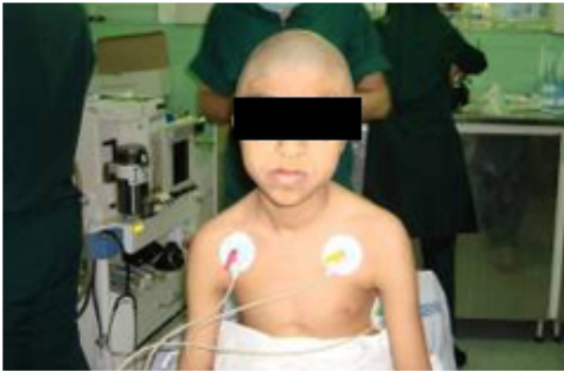
شکل (۱): تغییر فرم جمجمه بیمار و ایجاد فشار در حفره چشمی.

در این مقاله، یکی از جراحی‌های کرانیوپلاستی انجام شده در داخل کشور مورد بررسی و تحلیل قرار گرفته است. بیمار که در شکل (۱) نشان داده شده است، مبتلا به کرانیوسین استوزیس کروئال می‌باشد. بر اثر این بیماری، تغییر فرم در جمجمه بیمار ایجاد شده که به دلیل وجود فشار در حفره چشمی، متعاقباً بنیایی بیمار کاهش یافته است.