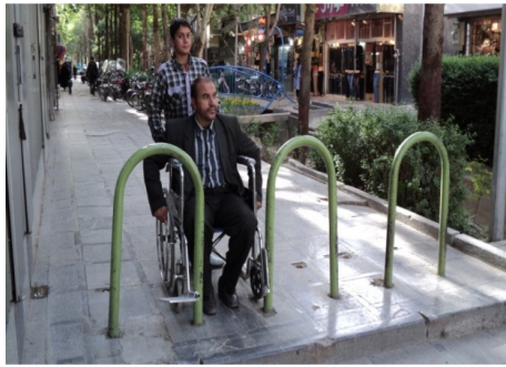
تصویر ۷: وجود موانع در ابتدای برخی ورودی‌ها