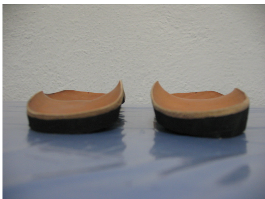
تصویر ۱: تصویر کفی با گوه خارجی - سمت راست، کفی بدون گوه - سمت چپ

به منظور تجزیه و تحلیل اطلاعات، دو پارامتر از منحنی‌های مؤلفه عمودی نیروی عکس‌العمل زمین استخراج شد: قله اول نیروی عکس‌العمل زمین در لحظه