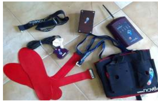
شکل ۱: بخش سخت‌افزاری دستگاه پدار

مقادیر میانگین و انحراف معیار متغیرها شامل حداکثر فشار، حداکثر نیرو و سطح تماس به اختصار در جدول ۱ بیان شده‌است. نتایج نشان داد که استفاده از کفی سبب کاهش معنادار فشار در ناحیه داخل پاشنه و افزایش معنادار فشار در ناحیه میانی پا نسبت به کفش شد ( P < 0.05 ). از نظر حداکثر نیرو در نواحی میانی-داخلی پا و پاشنه اختلاف معناداری بین دو حالت کفش و کفی طبی وجود داشت به گونه‌ای که حداکثر نیرو با استفاده از کفی در ناحیه پاشنه کاهش یافته و در ناحیه میانی داخلی پا افزایش می‌یافت ( P < 0.05 ). نتایج همچنین نشان داد که سطح تماس در ناحیه میانی-داخلی پا با استفاده از کفی طبی در مقایسه با کفش به طور چشمگیری افزایش پیدا کرد ( P < 0.05 ).