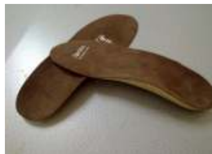
شکل ۲: کفی دارای حمایت قوس طولی

جهت آشنایی آزمودنی با آزمون، یک مرحله تست به صورت تمرینی به مدت ۳ دقیقه به همراه مجموعه پدار در یک مسیر ۹ متری از فرد گرفته شد. آزمون در دو مرحله راه رفتن با کفش و راه رفتن با کفی و کفش انجام شد. برای اجتناب از اختلاف در کفش شرکت‌کنندگان، از کفش‌های بند دار با سایز مناسب، سبک و با پاشنه سرتاسری در طی آزمون استفاده شد. کفی استفاده شده در این مطالعه کفی پیش‌ساخته با قوس طولی داخلی بوده که از دولایه سخت‌تر EVA I در زیر و لایه نرم‌تر چرمی به عنوان لایه رویی تشکیل شده است (شکل ۲). آزمون در هر مرحله با ۳ دور پیمودن مسیر مستقیم ۹ متری و با سرعت معمولی با فرکانس ۵۰ هرتز انجام پذیرفت. جهت تجزیه و تحلیل داده‌ها کف پا به هفت منطقه آناتومیکی شامل ناحیه داخل و خارج پاشنه، ناحیه میانی-داخلی پا، ناحیه میانی-خارجی پا، ناحیه داخل جلوی پا، ناحیه میانی جلوی پا و ناحیه خارج جلوی پا تقسیم‌بندی شد (شکل ۳). پارامترهای محاسبه شده در هر ناحیه شامل حداکثر فشار (کیلوپاسکال)، حداکثر نیرو (نیوتن بر کیلوگرم) و سطح تماس (سانتی‌متر مربع) بود.