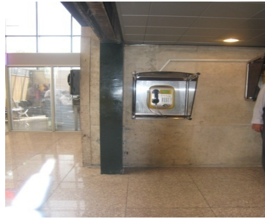
شکل ۱: تلفن عمومی سالن عمومی با ارتفاع مناسب (۴)

در سالن عمومی ترمینال ۲ چهار تلفن عمومی وجود دارد که ارتفاع یکی از آن‌ها کمتر از مابقی است تا برای افراد با صندلی چرخدار قابل استفاده باشد (ضمن اینکه فضای کافی مقابل تمام تلفن‌های عمومی این قسمت وجود دارد و افراد با صندلی چرخدار به راحتی می‌توانند به آن‌ها دسترسی داشته باشند). طراحی کیوسک روزنامه فروشی خودکار- با توجه به محل وارد کردن پول و دریافت روزنامه- نیز برای استفاده با صندلی چرخدار مناسب است.