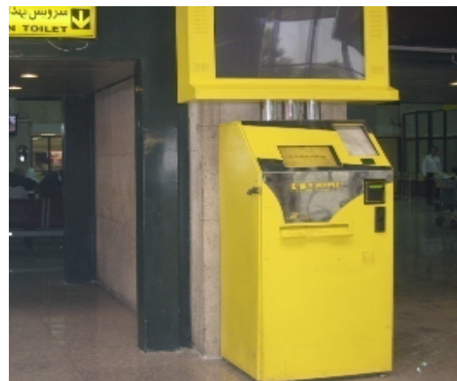
شکل ۲: روزنامه فروشی خودکار سالن عمومی با ارتفاع نامناسب (۴)